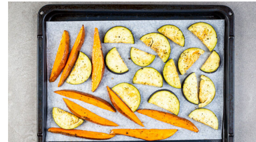
2. Gemüse backen

Den Backofen auf 220°C (200°C Umluft) vorheizen. Die Süßkartoffel samt Schale längs halbieren und in ca. 1cm dicke Spalten schneiden. Die Aubergine längs halbieren und in ca. 0,5cm dicke Scheiben schneiden. Das Gemüse auf ein mit Backpapier ausgelegtes Backblech geben.