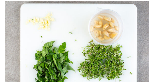
5. Creme vorbereiten

Das Fleisch und die Tomaten nach ca. 15Min. Garzeit zu dem Gemüse auf das Backblech geben und im Ofen 20-25Min. backen, bis das Fleisch gar und das Gemüse appetitlich gebräunt ist.