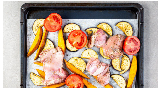
4. Fleisch und Gemüse backen

Das Fleisch trocken tupfen. Die Tomaten halbieren. Das Fleisch und die Tomaten mit 1EL Olivenöl beträufeln und mit der restlichen Gewürzmischung sowie je 1 Prise Salz und Pfeffer würzen.