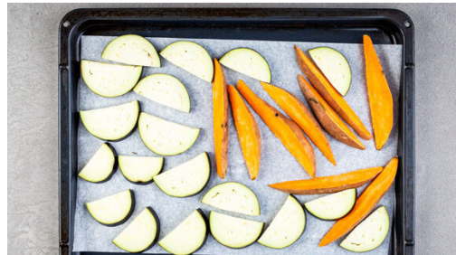
1. Gemüse schneiden

Energie 812kcal, Fett 59.6g, Kohlenhydrate 37.2g, Eiweiß 36.0g