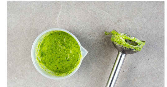
6. Creme zubereiten

In einem Wasserkocher die notwendige Mindestmenge an Wasser aufkochen und die Cashews in einem hohen Gefäß mit 40ml kochendem Wasser übergießen. Den Knoblauch schälen und grob würfeln. Das Basilikum und die Petersilie samt Stängeln grob schneiden, dabei einige Petersilienblätter für die Garnitur beiseitelegen.