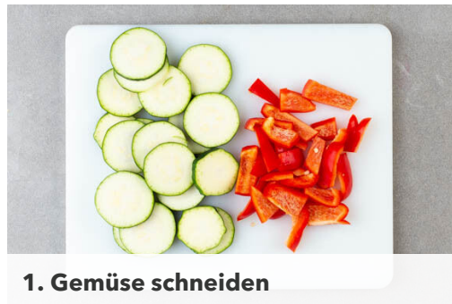
1. Gemüse schneiden

Energie 768kcal, Fett 30.6g, Kohlenhydrate 95.9g, Eiweiß 29.1g