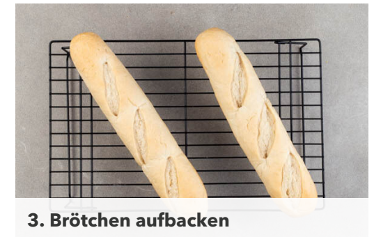
3. Brötchen aufbacken

Den Thunfisch in einem Sieb abtropfen lassen. Die Zitrone halbieren und auspressen. Den Thunfisch mit 2EL Mayonnaise, 2EL Zitronensaft und 2EL Wasser vermengen und gut mit Salz und Pfeffer abschmecken.