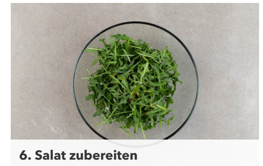
6. Salat zubereiten

Die Brötchen auf dem Ofenrost in ca. 8Min. knusprig aufbacken. Bis zur weiteren Verwendung leicht abkühlen lassen.