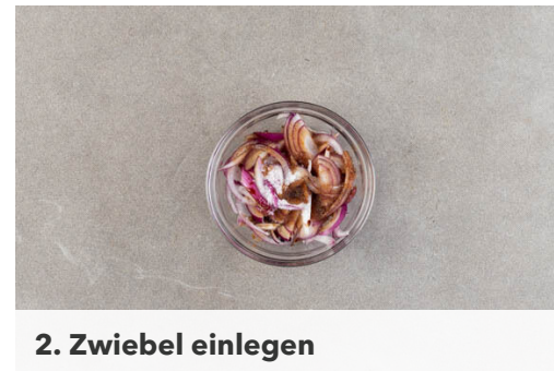
2. Zwiebel einlegen

Die Paprika und die Zucchini in einer großen Pfanne mit 1EL Olivenöl und der Gewürzmischung bei mittlerer Hitze unter gelegentlichem Rühren 7-8Min. braten, bis das Gemüse gar, aber noch etwas bissfest ist. Mit Salz und Pfeffer abschmecken.